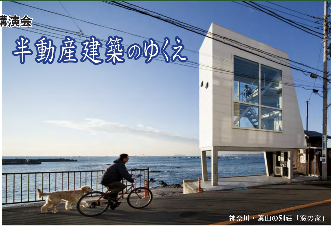
神奈川・葉山の別荘「窓の家」

2018年日本建築学会作品選奨・日本建築設計学会賞大賞(フクマスベース)/2016年WADA賞(フクマスベース)/2014年AP賞(Window House)・日本建築学会作品選奨(中川政七商店新社屋)/2011年JCDデザインアワード大賞(Red Light Yokohama)/2011年日本建築学会作品選奨(Nowhere but Sajima)/2010年グッドデザイン賞特別賞(中川政七商店新社屋)/2010年住宅建築賞金賞(Nowhere but Sajima)2009年アジアデザイン賞(Nowhere but Hayama)2006年吉岡賞(ドリフト)2013年/KJ 2013年1月号吉村靖孝特集(KJ)/2012年ビヘイヴィアとプロトコル(LIXIL出版)/他