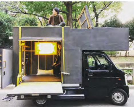
モバイルハウス/フクマスベース